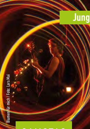
Blumen für mich